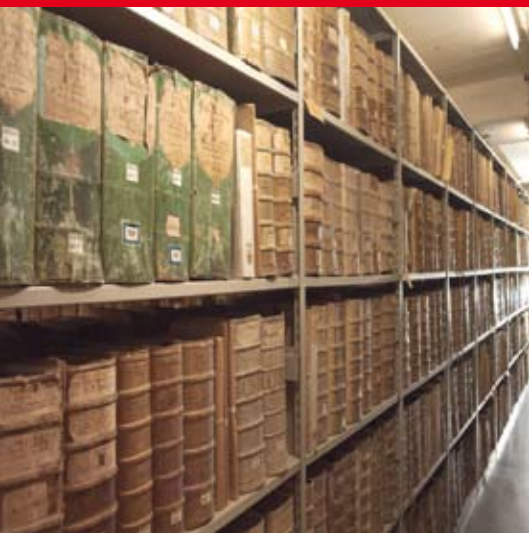
Schritt für Schritt zu Ihrer digitalen Bibliothek

Workflow-Software zur Massendigitalisierung